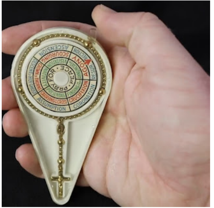
مسيحة على شكل بوصلة

تستمر المسيحة نفسها، وممارسة الصلاة بها، في التطور والتجدد اليوم. في عام 2019، أطلقت مجموعة كنسية جهاز يمكن ارتداؤه يتصل بتطبيق على الهاتف لمساعدة المصلين على تعلم صلاة المسيحة.