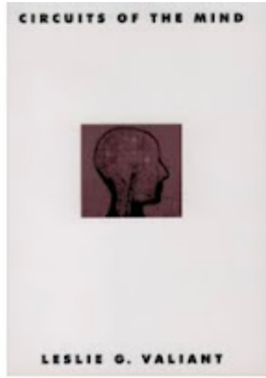
كتاب دوائر العقل العصبية

لقد أمضى ليزلي فاليان Leslie Valiant ، أستاذ علوم الكمبيوتر والرياضيات التطبيقية في كلية جون إتش بولسون للهندسة والعلوم التطبيقية، جامعة هارفارد، عقودًا من الزمن في دراسة الإدراك البشري. الكتب التي اصدرها ومنها كتاباه: "دوائر العقل العصبية (1)", ومؤخرًا كتاب: "أهمية أن تكون قابلاً للتعلم (2)", شهادة على ذلك الجهد.