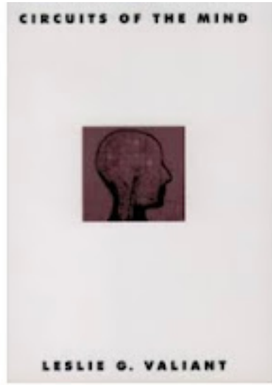
كتاب دوائر العقل العصبية

لقد أمضى ليزلي فاليان Leslie Valiant ، أستاذ علوم الكمبيوتر والرياضيات التطبيقية في كلية جون إتش بولسون للهندسة والعلوم التطبيقية، جامعة هارفارد، عقودًا من الزمن في دراسة الإدراك البشري. الكتب التي اصدرها ومنها كتاباه: "دوائر العقل العصبية (1)"، ومؤخرًا كتاب: "أهمية أن تكون قابلاً للتعلم (2)"، شهادة على ذلك الجهد.